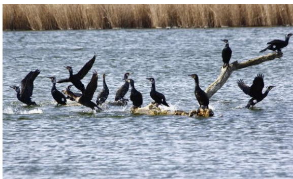
Ansammlung von Kormoranen

Schöne Frühlingstage wünscht der Naturpark Unteres Saaletal