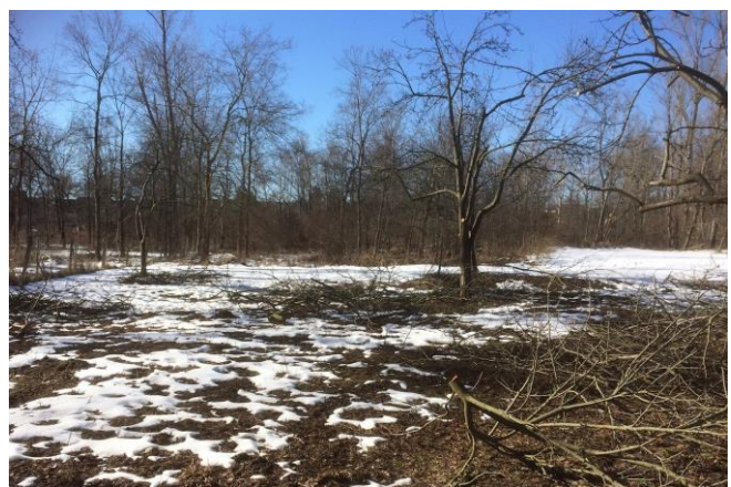
Streuobstwiese am Naturlehrpfad Sprohne

Zur Sicherung der historischen Nutzungsform Streuobstwiese als Landschaftselement hat der Naturpark Unteres Saaletal im Rahmen des Artensofortförderungsprogramms des Landes Sachsen-Anhalt eine Streuobstwiesenpflege am Naturlehrpfad Sprohne durchgeführt. Hierfür erhielten die Obstbäume einen fachgerechten Schnitt und die Wiese wurde gemäht. Darüberhinaus wird der Lehrpfad durch eine weitere Infotafel zum Thema „Streuobst“ ergänzt.