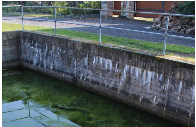
Löschteich in Wils

Neben dem ehemaligen Trafoturm in Wils , der im Rahmen eines Kooperationsprojektes zwischen unserem Naturpark und dem Verein Artenschutz in Franken® in einen Artenschutzurm umgewandelt werden soll, befindet sich ein Löschteich. Auf Anraten der Unteren Naturschutzbehörde des Saalekreises wurde hier im Auftrag des Naturparks Unteres Saaletal eine Amphibienleiter als Artenschutzmaßnahme etabliert.